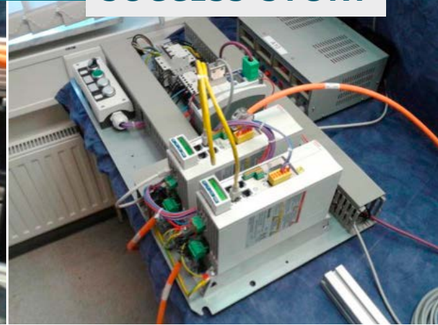
Aufbau des Prüfstands